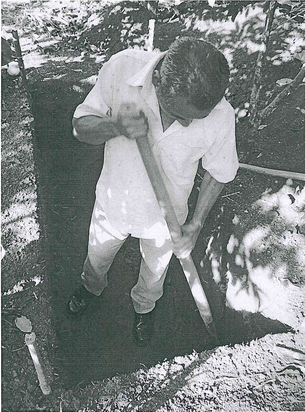
Figura 2. Fotografía de la Sub-operación BB4bso(Parque Arqueológico Nacional Tak'alik Ab'aj, MICUDE, DGPCN/IDAEH 2019).