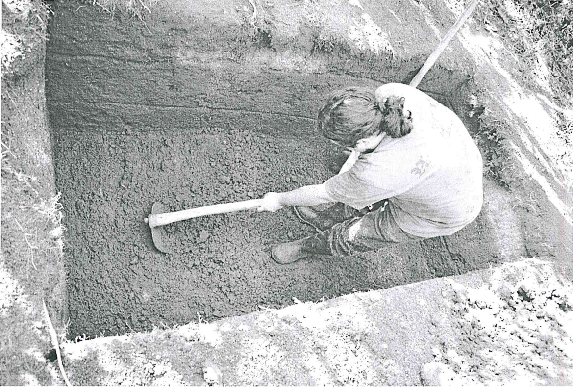
Figura 3. Fotografía de la Operación BB3a(Parque Arqueológico Nacional Tak'alik Ab'aj, MICUDE, DGPCN/IDAEH 2019).